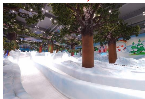
毛林金灣冰雪世界

在這裏你可以一站式帶娃從早玩到晚，小朋友玩到不願意走一定要來來珠海打卡“爾濱”同款冰雪世界新開的#珠海毛林金灣大酒店珠海最最最大的冰雪運動城約6000m 2 ,3500m 2 「兒童遊樂城」小朋友蕙愛的巨型城堡、海洋球池、碰碰車...這裏全都有恆溫無邊際游泳池,孩子開心，家長解放雙手。