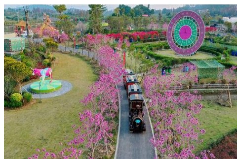
珠海嶺南大地百草園

百草園是嶺南大地首期推出的趣味體驗中醫藥文化、24 節氣互動文化景觀和嶺南文化的一站式休閒養生度假園區。它總占地 400 餘畝，依託嶺南大地萬畝生態田園，巧妙地結合沉浸式互動科技和中國傳統文化元素，打造成粵港澳大灣區首屈一指的本草樂園。嶺南大地百草園遊樂專案包括水上碰碰船、腳踏船、射擊、射箭、將軍炮、彩虹滑道、沙灘車、卡丁車、小火車、無動力樂園、小番茄採摘、萌寵互動餵養與真人在心跳中感受